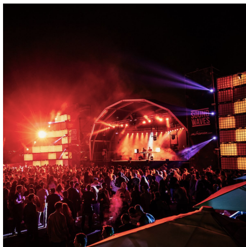
@ Facebook Festival Sound Waves